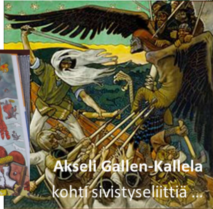
Akseli Gallen-Kallela kohti sivistyseliittiä ...